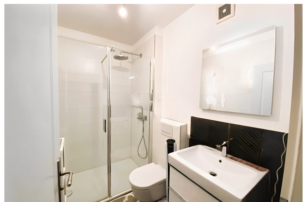
bath 2 AS IMMOBILIEN