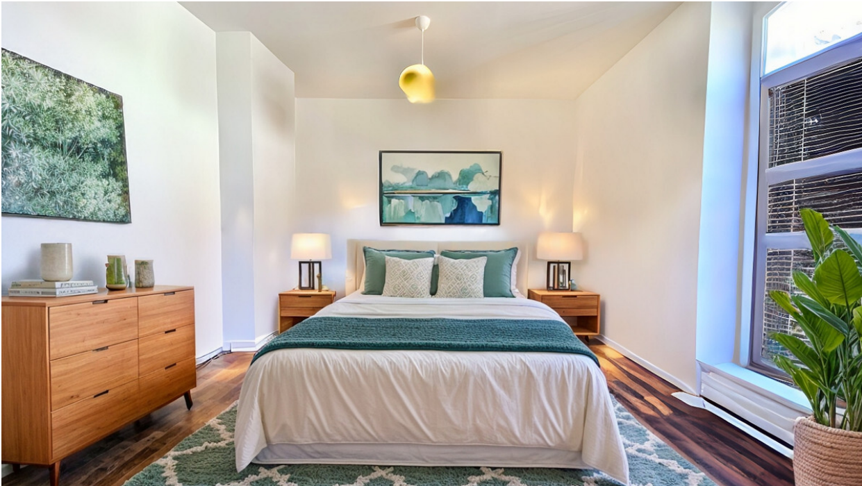
bedroom VS AS IMMOBILIEN 1.1