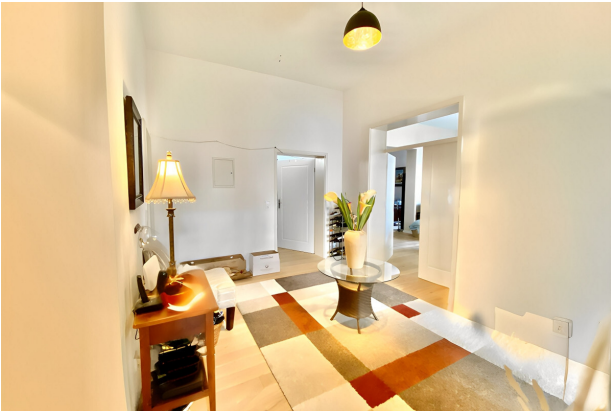
hallway AS IMMOBILIEN