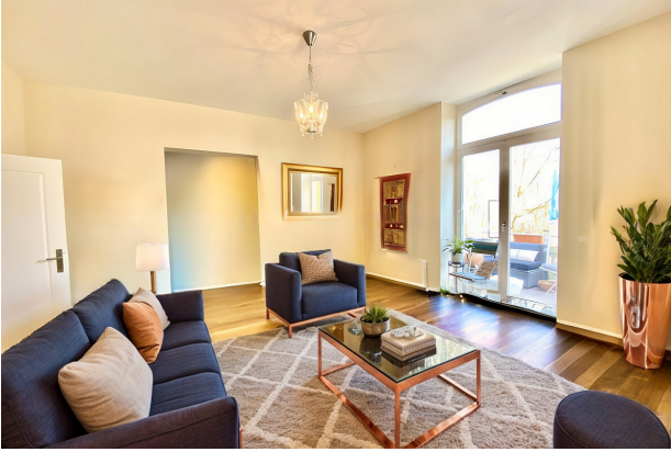
living room VS AS IMMOBILIEN 1.1