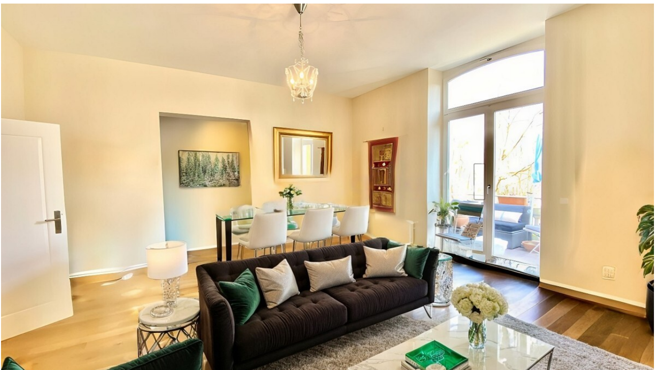
living room VS AS IMMOBILIEN 0