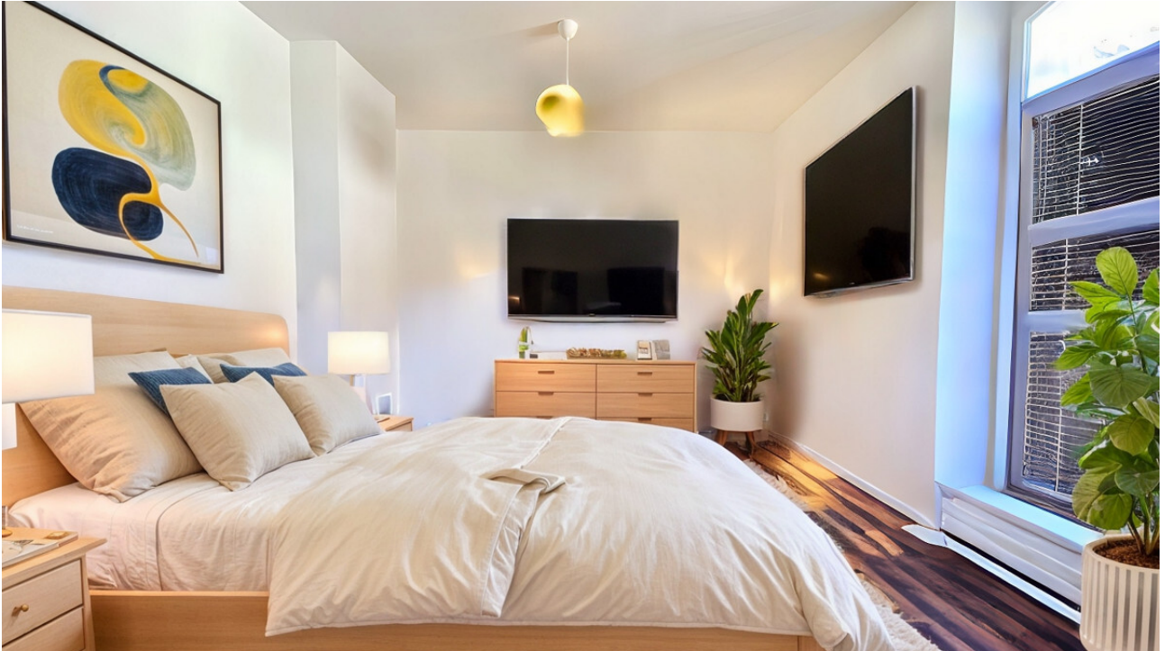
bedroom VS AS IMMOBILIEN 1.2