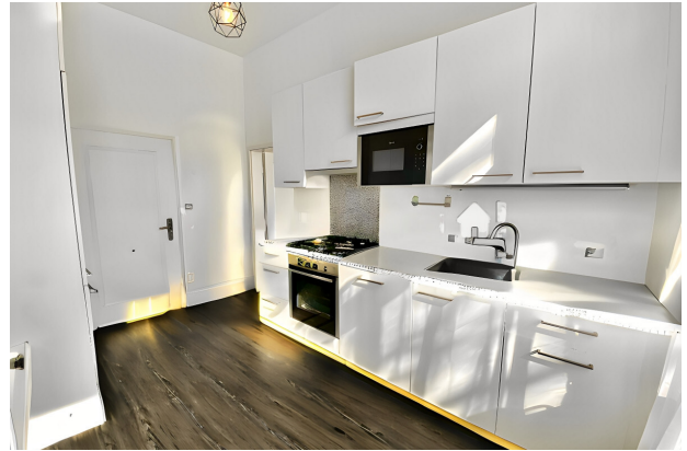
kitchen VS AS IMMOBILIEN 0