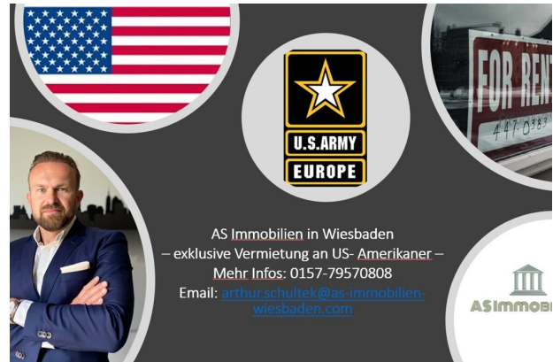
AS Immobilien Wiesbaden Immobilienmakler Vermietung