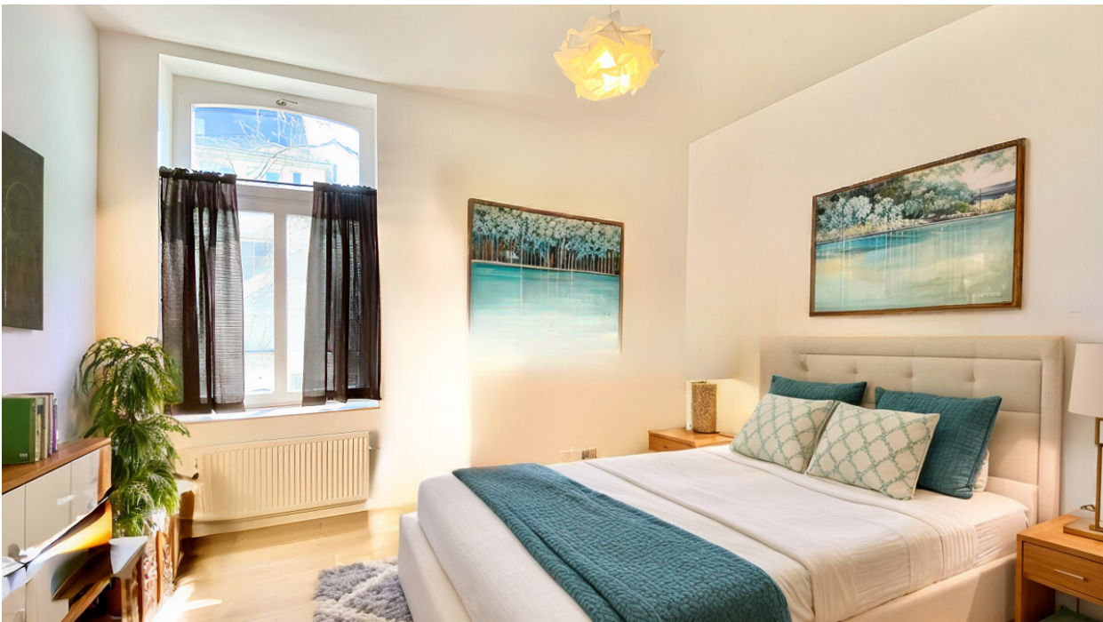
bedroom VS AS IMMOBILIEN 1.2