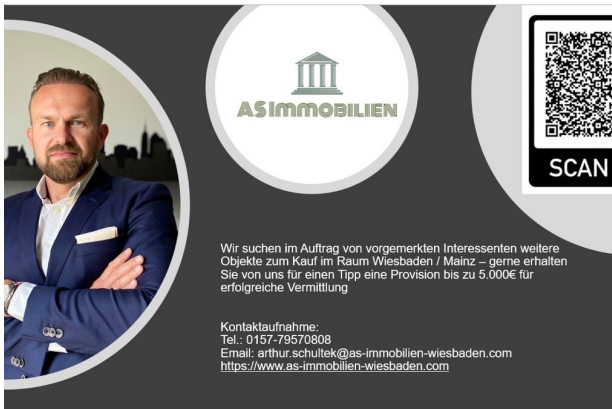
AS immobilien Verkauf von Immobilien