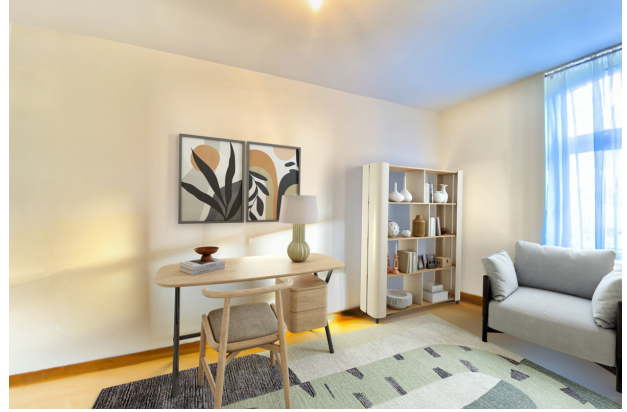
Office VS AS IMMOBILIEN